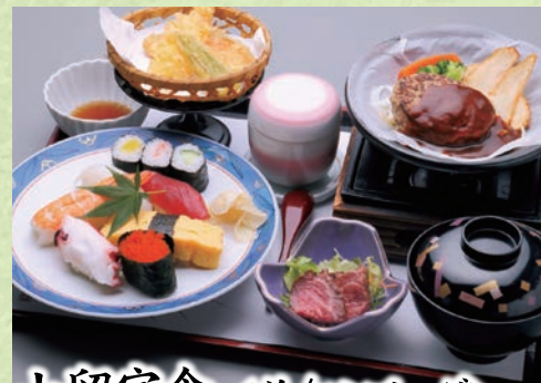
山留定食 〈並/ハンバーグ〉 1,630円(税込1,793円)