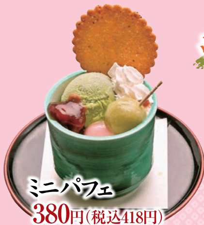
ミニパフェ 380円(税込418円)