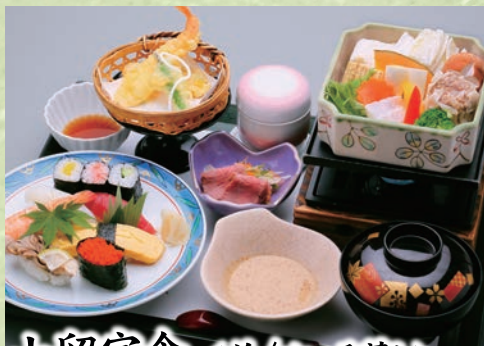
山留定食 〈並/せいろ蒸し〉 1,680円(税込1,848円)