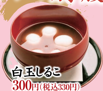
白玉しるこ 300円(税込330円)