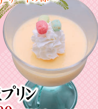
姫プリン 280円(税込308円)