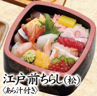
江戸前ちらし(松) 〈あら汁付き〉 2,200円(税込2,420円)