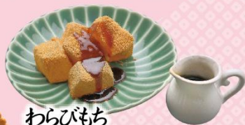
わらびもち 300円(税込330円)