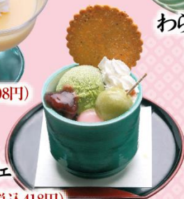
ミニパフェ 380円(税込418円)