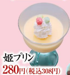
姫プリン 280円(税込308円)