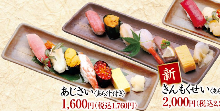
あじさい 〈あら汁付き〉 1,600円(税込1,760円)