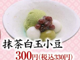
抹茶白玉小豆 300円(税込330円)