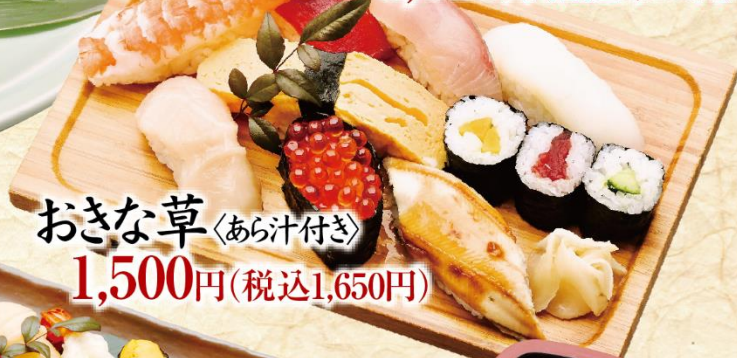
おきな草 〈あら汁付き〉 1,500円(税込1,650円)