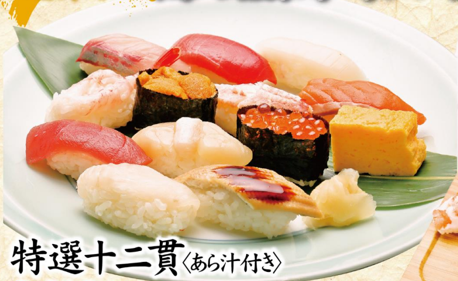
特選十二貫 〈あら汁付き〉 2,600円(税込2,860円)