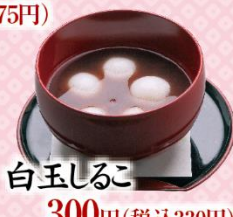
白玉しるこ 300円(税込330円)